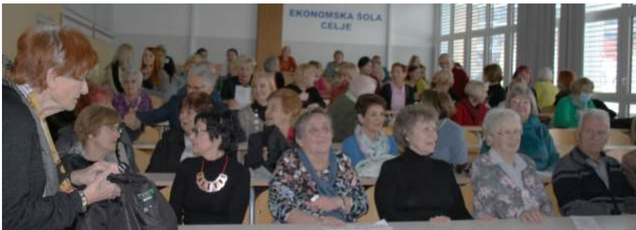
Pred začetkom prireditve

Glasbeno-družabno srečanje z upokojenimi sodelavci šole, ki povezuje vrhunsko glasbo in druženje, je odlična priložnost za ohranjanje dobrih medsebojnih odnosov z nekdanjimi sodelavci, hkrati pa priložnost, na kateri lahko naša šola izkazuje hvaležnost in spoštovanje nekdanjim sodelavcem, ki so prispevali k našemu ugledu in razvoju.