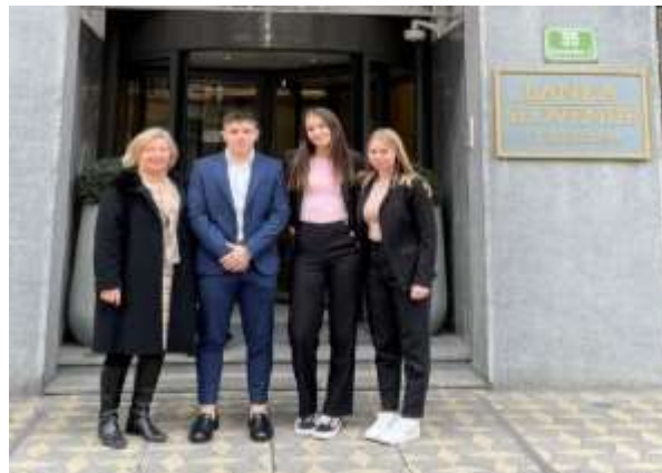
Ekipa Podjetniki pred Banko Slovenije

V ponedeljek, 20. 3. 2023, sta se obe naši ekipi predstavili v finalu nacionalnega srednješolskega tekmovanja Generacija Euro, ki se je po dveh letih ponovno »v živo« odvijalo v naši osrednji bančni instituciji, Banki Slovenije.