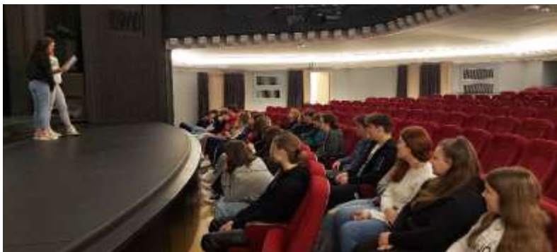
Dijaki 1. e v SLG Celje

V okviru interesnih dejavnosti je bila v mesecu oktobru za vse dijake 1. letnika izvedena gledališka vzgoja. V SLG Celje so preživeli dve uri. Izvedeli so, kako nastaja gledališka predstava, več o igralskem poklicu, se seznanili z osnovnimi izrazi, ki so povezani z gledališčem in dramskim besedilom, se sprehodili po gledaliških prostorih in za trenutek tudi sami postali igralci na odru.