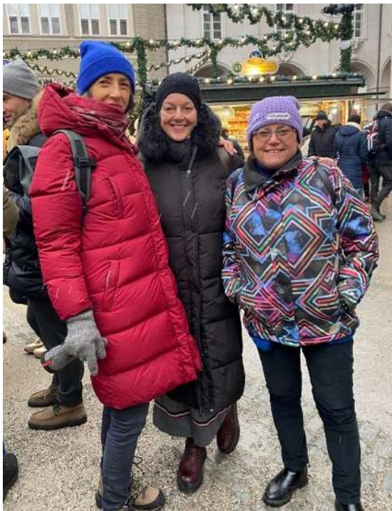
Spremljevalke na izletu

kupili tudi za domov. Polni prazničnega vzdušja smo se ob dogovorjeni uri zadovoljni odpravili proti avtobusu.