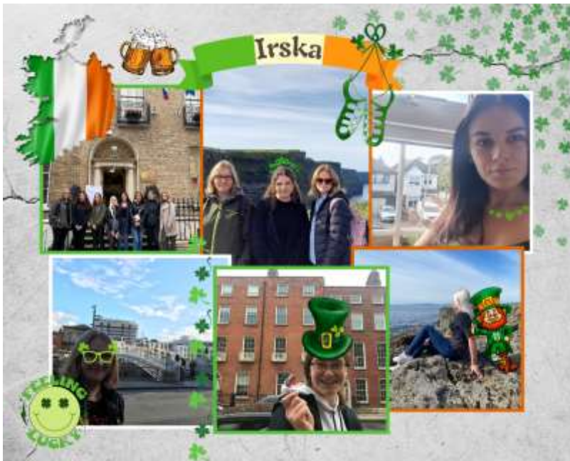
Odprava na Irsko

V prostem času je skupina raziskovala Malto. Obiskali so glavno mesto Valletto, se sončili in plavali na otoku Comino, raziskali otok Gozo ter seveda Malto. Po nekaj dneh so usvojili tudi slavno nemogoč malteški javni promet, tako da bolje res ne bi moglo biti.