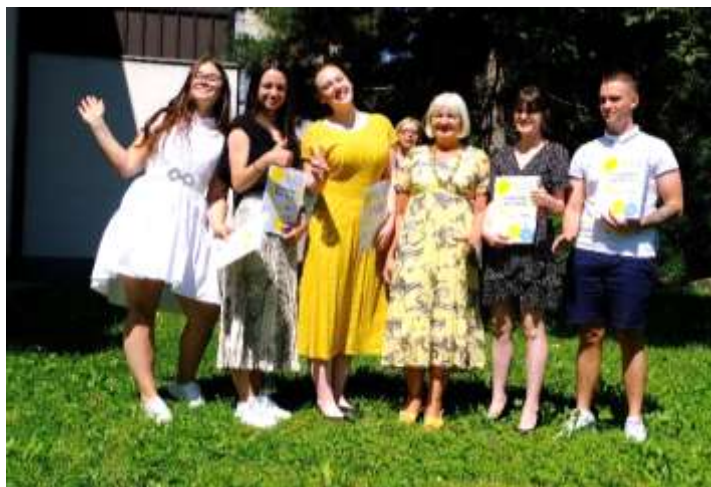
Maturanti maturitetnega tečaja

V okviru splošne mature je 20 kandidatov, ki so opravljali ali že opravili poklicno maturo, pisalo dodatni maturitetni izpit. Uspešnih je bilo 12 kandidatov ali 60 %.