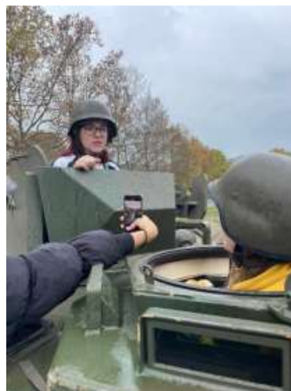
Morda nekoč v službi domovine?