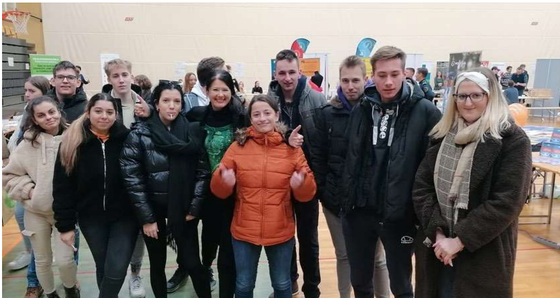
Karierni sejem za mlade GCC

Vsem, ki zaključujete izobraževanje pri nas, želim veliko uspeha pri poklicni oziroma splošni maturi in zaključnem izpitu, da bi bili sprejeti v programe, ki ste si jih izbrali, in da bi študij uspešno končali.