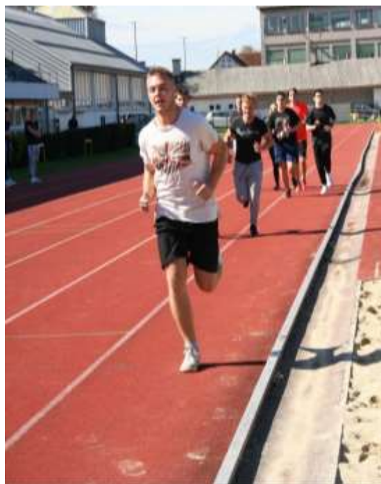
Atletski četverboj – tek na 600 m