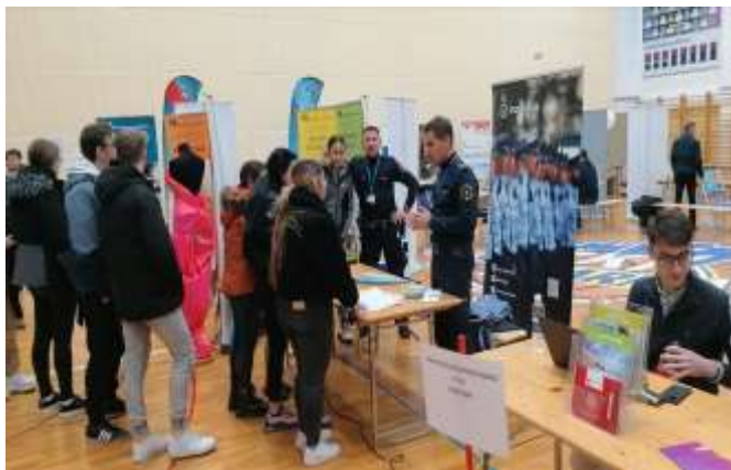
Predstavitve poklica policist na kariernem sejmu za mlade na GCC

V sklopu karierne orientacije smo imeli na obisku policiste, ki so dijakom predstavili svoj poklic, njegove prednosti in slabosti ter odgovarjali na vprašanja dijakov. Konec leta 2022 in v začetku leta 2023 so potekale različne predstavitve študijskih programov, kot so karierni sejmi ter sklopi predstavitev študijskih programov in poklicev. Dijaki so bili obveščeni o dogodkih preko šolskega radia in elektronskih sporočil v eAsistentu.