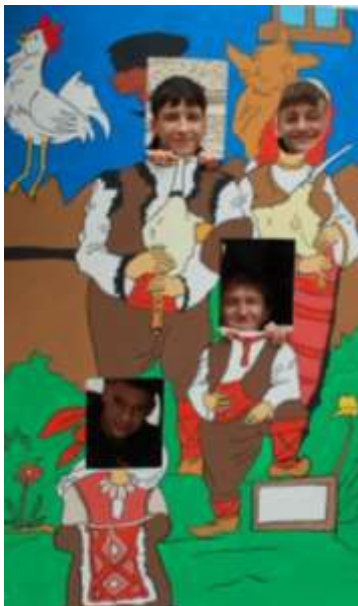
Pano bolgarske narodne noše