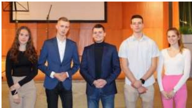
Odbor – predsedstvo DSC in predsednik DOS

Smo četrta regijska dijaška skupnost v državi in prepričani smo, da lahko tudi v Celju s skupnimi močmi ustvarimo skupnost, ki bo povezana in enotna za dobrobit nas vseh. Srednja šola je skupnost ljudi, ki se zavzemajo za uspeh, predvsem pa za nove veščine, ki jih pridobivamo skozi šolanje. Čez vso dobo izobraževanja tvorimo celoto z ogromno poznanstvi in s še več spletenimi vezmi.