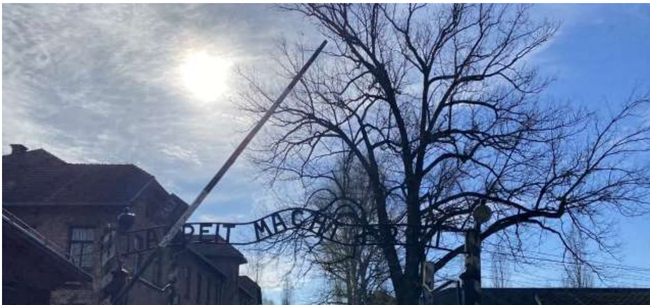
ARBEIT MACHT FREI (Delo osvobaja) – Auschwitz, Poljska