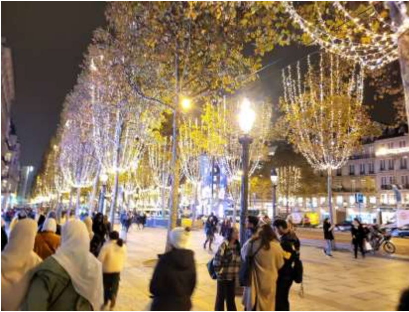
Praznično okrašene Elizejske poljane

Francozi so hedonisti in sprehod z njimi, kupovanje lokalnih dobrot v marketih, degustiranje hrane ali samo posedanje ob Seni in opazovanje domačinov ter praznično okrašenih ulic so naša nepozabna doživetja.