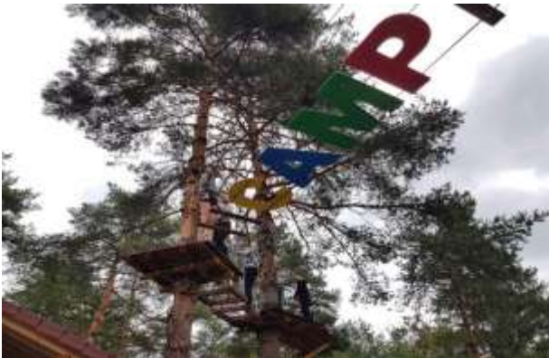
Dijaki višjih letnikov v adrenalinskem kampu Menina

Nekaj oproščenih dijakov je v šoli za uvod izvedlo dihalne vaje za krepitev pljučne kapacitete in posledično imunskega sistema ter zmanjševanje stresa. Sledil je ogled filma o zdravem načinu življenja in pogovor o zdravstvenih težavah.