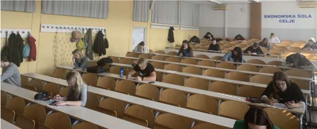
Utrinek s šolskega tekmovanja iz znanja ekonomije in gospodarstva

V okviru DMFA smo 23. 3. 2023 dijake četrtega letnika povabili na šolsko tekmovanje iz znanja ekonomije in gospodarstva. Tekmovanja se je udeležilo sedem dijakov iz programa ekonomske gimnazije in 13 dijakov iz programa ekonomski tehnik.