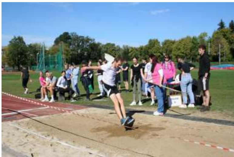
Atletski četverboj – skok v daljino