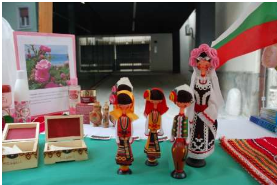
Bolgarska vrtnica – simbol države