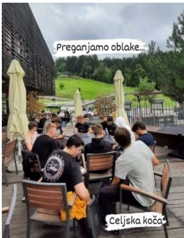
Dijaki tretjega in četrtega letnika na Celjski koči

15. septembra 2022 smo kljub nestanovitnemu vremenu izpeljali jesenski športni dan. Temperature so bile visoke, a na koncu so nas vseeno osvežile dežne kaplje. Dijaki 1. letnika so krenili proti Šmartinskemu jezeru, dijaki 2. letnika proti Tremerjam, višji letniki pa so izbirali med adrenalinskim kampom Menina in pohodom na Celjsko kočo.