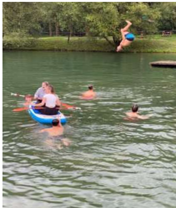
Uživanje v vodi (Kamp Menina)