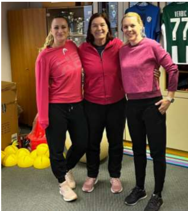
Ženski del kolektiva športne vzgoje

Tudi na začetku tega šolskega leta smo v aktivu športne vzgoje aktivnosti za dijake zastavili zelo optimistično. Naš cilj je bil šport in vadbo približati dijakom na način, da bi v njem uživali oziroma poiskali smisel. Skrbno smo načrtovali atletski četverboj, športne dneve in tradicionalna medrazredna tekmovanja v odbojki za dijakinje 3. in 4. letnika, nogometu za dijake, šolsko prvenstvo v ulični košarki 3 x 3 za dijake in prvenstvo v namiznem tenisu. Vse zastavljeno smo tudi uspešno realizirali. Veseli smo bili velikega odziva dijakov. S tem potrjujemo, da je šport na šoli še kako prisoten in dijakom zelo pomembna obrobna dejavnost.