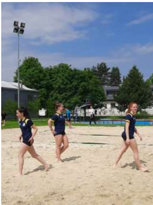
Iz igre ...