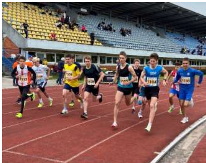
Start teka na 2000 m