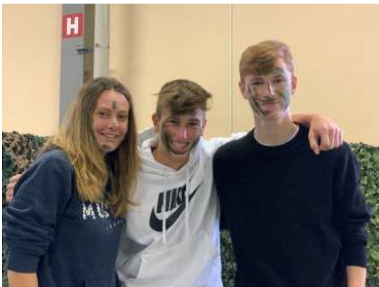
V bojnih barvah

V zadnjem delu je sledil ogled dinamične vaje in vojaških veščin. Dijakom so demonstrirali boj s tanki in primer reševanja ranjenca z vojaškim reševalnim vozilom. Predstavili so tudi častno četo, himno ter dvig in spust zastave. Slovenski vojak je bil predstavljen kot bojevnik 21. stoletja – visoko usposobljen, opremljen in pripravljen na delovanje v najtežjih razmerah. Morda pa se kateri izmed dijakov odloči za poklic vojaka.