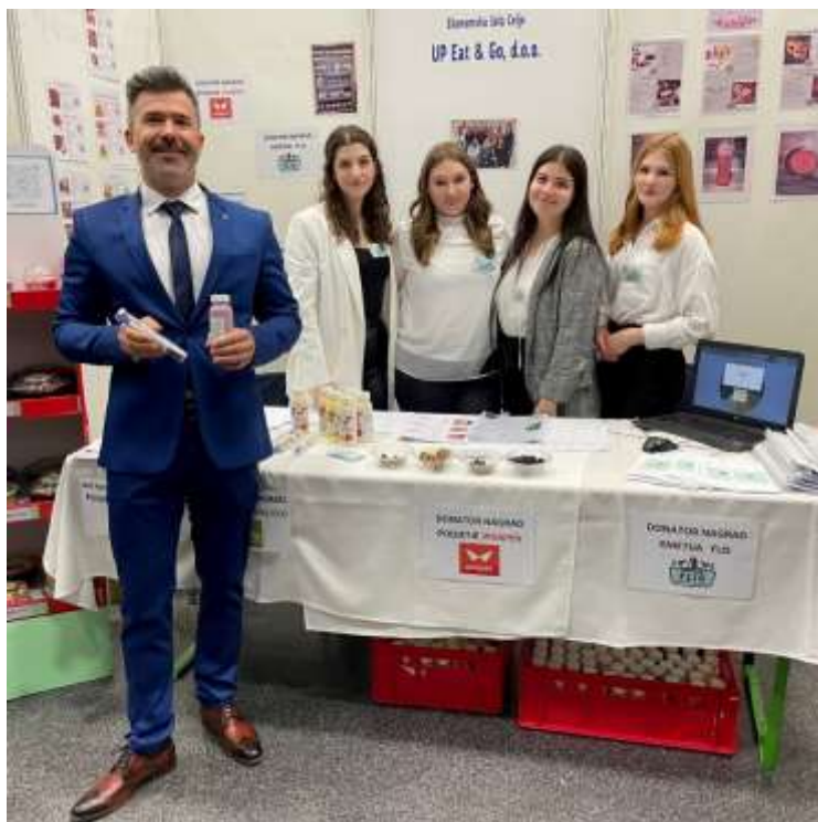
Obisk podžupana MOC Uroša Lesjaka na stojnici UP Eat&Go

Obe podjetji je obiskal tudi minister za gospodarstvo Matjaž Han, ki je pokazal veliko zanimanje za dejavnost in aktivnosti obeh podjetij. Z izjemno samozavestjo so dijaki odgovarjali na zanimiva vprašanja podžupana MOC Uroša Lesjaka, ki je bil nad obema podjetjema navdušen.