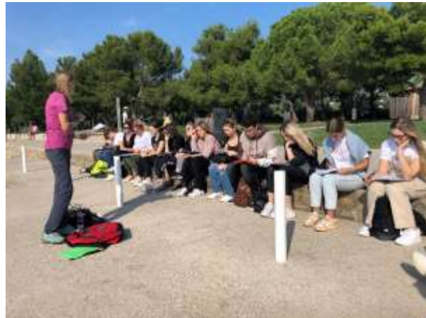
Dijaki pri analizi morske vode

V okviru priprav na maturo iz geografije in zgodovine smo se letos odpravili na Obalo. Terensko delo pri predmetu geografija smo izvedli v sodelovanju z Oddelkom za geografijo Univerze na Primorskem. Terensko delo smo začeli na gradu Socerb, od koder je čudovit pogled na Kraški rob in morje. V nadaljevanju so dijaki, ki se pripravljajo na maturo iz geografije, izvedli kartiranje Kopra ter spoznavali geomorfološke značilnosti obale in lastnosti morske vode.