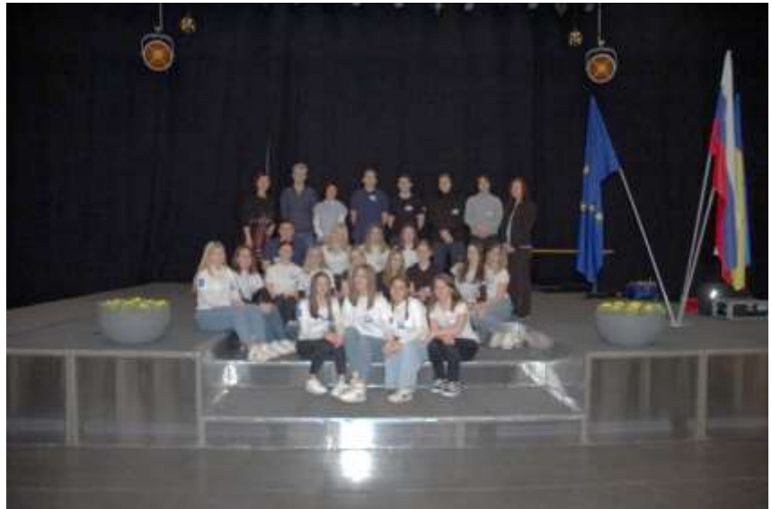
Sodelujoči na 17. Mednarodnem sejmu učnih podjetij