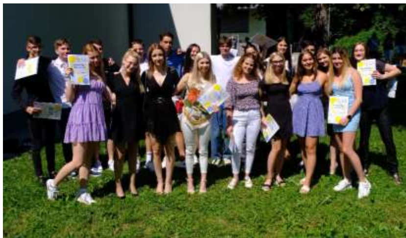
Maturantje 4. e-razreda

Maturo opravljajo: 26 dijakov. Maturo opravilo: 26 dijakov ali 100 %.