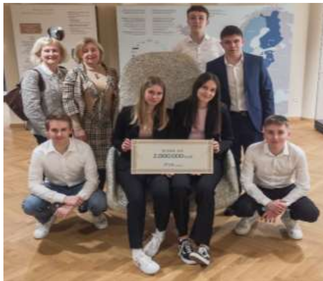
Muzej BS: ob stolu za 2 milijona evrov

Pred sklepno slovesnostjo smo se odpravili v Muzej Banke Slovenije, kjer smo si pogledali kronologijo dogodkov od osamosvojitve naše države in s tem od uvedbe svojega denarja, tolarja, do danes. Ogledali smo si lahko vse bankovce in kovance, ki smo jih imeli in jih še imamo, od osamosvojitve do danes. V muzeju je razstavljen prvi bankomat, na ogled so še čeki, hranilniki, boni, ki so bili pred tolarji ... Na zanimiv način je prikazano delovanje centralne banke, ki skrbi za stabilnost cen, nadzoruje bančni sistem in skrbi za komercialne banke v težavah.