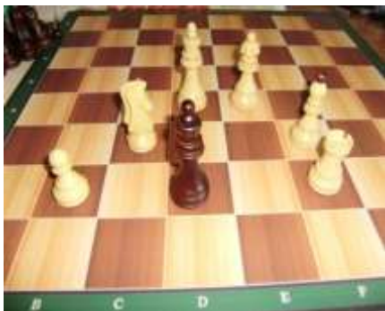
Šahovska plošča in figure

V letošnjem šolskem letu smo na Ekonomski šoli Celje izvajali šahovski krožek ob sredah, in sicer 8. šolsko uro. Dijaki posameznih razredov so prejeli figure in šahovske table ter se med sabo pomerili v šahovskih dvobojih ali pa so reševali šahovske probleme z učnih listov. Skupno uro krožka je bilo težje poiskati, saj dijaki različno končajo s poukom, 8. ura pa jim že predstavlja dodaten napor.