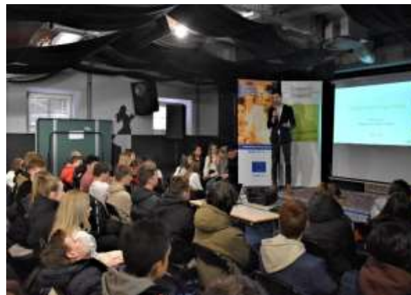
Karierni sejem za mlade na Gimnaziji Celje – Center

V šolskem letu 2022/2023 je svetovalna služba poleg individualnega in skupinskega svetovanja izvajala tudi karierno svetovanje za dijake zaključnega letnika na naši šoli. Karierno svetovanje je potekalo v vseh razredih zaključnega letnika z izvajanjem predavanj na temo poklicno in študijsko informiranje ter svetovanje. Vsem dijakom zaključnega letnika je bil podrobno predstavljen postopek vpisa na višješolske, visokošolske in univerzitetne ter enovite magistrske študije. Seznanjeni so bili tudi s podatki iz analize vpisa preteklih let. Vse informacije ter navodila za vpis so bila predstavljena in ažurirana tudi v spletni učilnici.