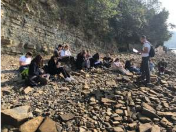
Terensko delo na obali v Strunjanu

Dijaki, ki se pripravljajo na maturo iz zgodovine, pa so si ogledali znamenite cerkev v Hrastovljah ter spoznavali zgodovinske znamenitosti Kopra. Terensko delo je potekalo v sproščenem vzdušju; k temu sta pripomogla tople, sončen jesenski dan ter pogled na slovensko morje.