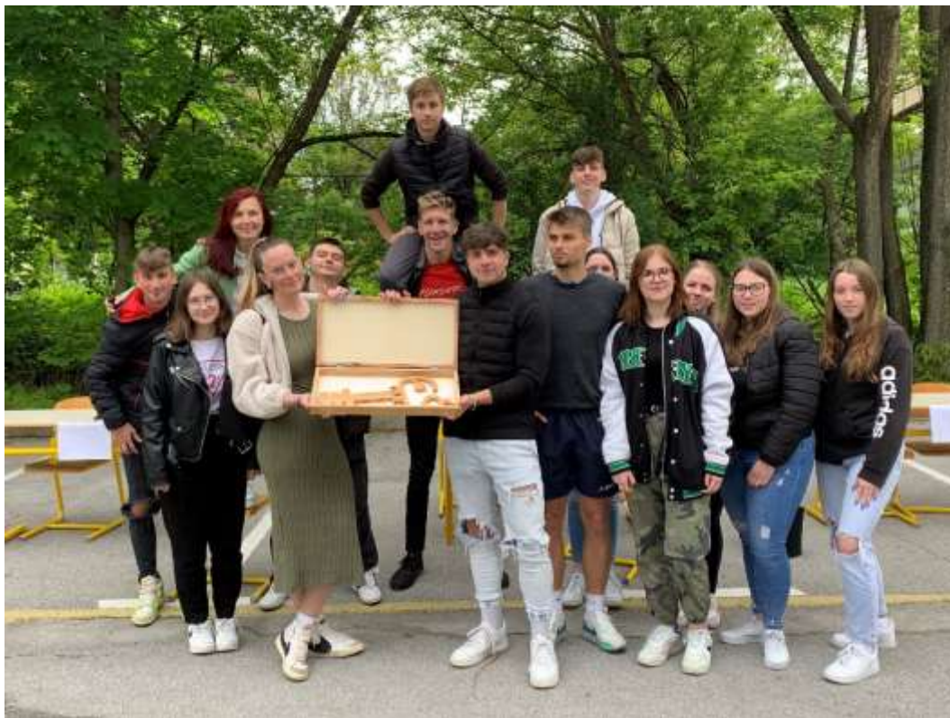
Novi varuhi ključa – 3. b