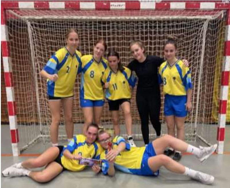
Ženska nogometna ekipa Ekonomske šole Celje

Dijakinje so se 17. 10. 2022 udeležile področnega tekmovanja v nogometu, na katerem so si priigrale prvo mesto v skupini. Po zmagi nad I. gimnazijo v Celju z rezultatom 2 : 0 in neodločenim izidom proti Srednji šoli za hortikulturo in vizualne umetnosti Celje so se uvrstile v finale področnega tekmovanja, kjer so odigrale dve tekmi in nasprotnice, I. gimnazijo v Celju in Gimnazijo Celje – Center, suvereno premagale. Uvrstile so se v četrtfinale državnega prvenstva, ki je potekalo 20. 1. 2023 v dvorani Leona Štuklja v Novem mestu. Dekleta so pokazala lepo igro in bila borbena do konca obeh tekem, vendar so na koncu, žal, izgubila.