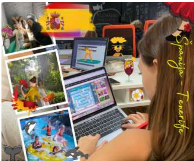
Potepanje po Španiji – Tenerifu

Naša zadnja skupina na mobilnosti v letu 2022 je bila namenjena v Španijo, priljubljeno destinacijo erazmovcev. Na pot so se odpravili 23. 10., polni pričakovanj, kakšna doživetja jih čakajo na otoku večne pomladi, Tenerifu.