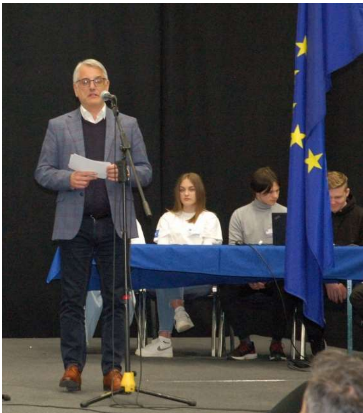
Nagovor ministra Hana

22. 3. 2023 smo po treh letih premora spet organizirali mednarodni sejem učnih podjetij in državno tekmovanje v dvorani Golovec v Celju. Na letošnjem sejmu je razstavljalo 47 učnih podjetij, in sicer 32 iz Slovenije in 15 iz tujine (Hrvaške, Belgije, Italije in Bolgarije). Zanimanje med dijaki in mentorji je bilo izredno veliko, saj sejem v živo spodbuja izmenjavo izkušenj ter navezovanje medsebojnih stikov, ki dijakom koristijo tudi v realnem življenju. Delodajalci namreč iščejo prilagodljive kadre z razvitimi mehкими veščinami. Inovativnost mladih je z budnim očesom spremljala strokovna štiričlanska ocenjevalna komisija, ki je na koncu razglasila zmagovalca. Državno in mednarodno tekmovanje je potekalo v kategorijah najboljša poslovna ideja in najboljši sejmski nastop. Tokrat so bili absolutni zmagovalci učno podjetje Brda Bubble s ŠC Nova Gorica. Sejem pa ni samo tekmovanje, je v prvi vrsti