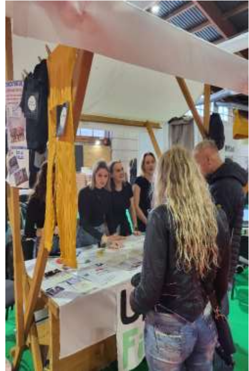
Dijakinje predstavljajo UP GymFit obiskovalcem.