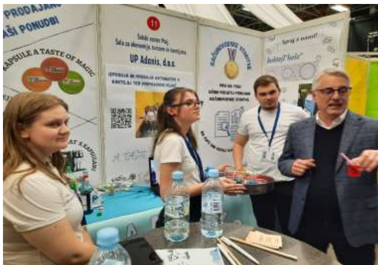
Ministrov sprehod med stojnicami

Oktobra smo za učitelje v učnih podjetjih organizirali dvodnevni seminar o aktualnih temah: uporaba računovodskega programa Minimax, motivacija za večjo samoiniciativnost dijakov, učno podjetje in poklicna matura 2023, primer dobre prakse vodenja učnega podjetja, nastopanje na domačih in tujih sejmih ter sodelovanje z okoljem, uporabna digitalna orodja v izobraževanju. Za zaključek smo si ogledali družinsko podjetje Savinjska pivovarna – Clef Brewery.