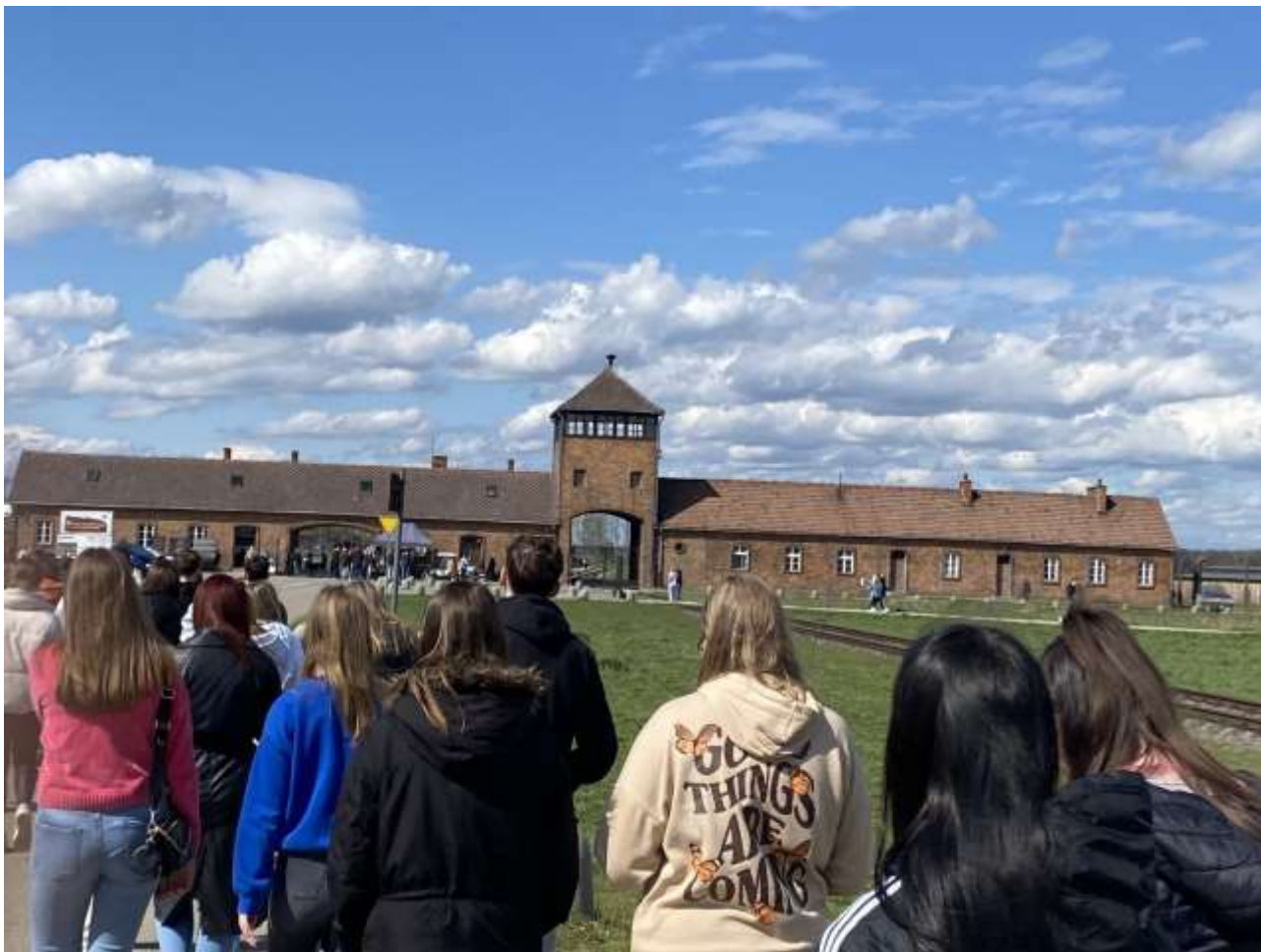
Vhod v koncentracijsko taborišče Birkenau, Poljska

V soboto so se zgodaj zjutraj odpeljali proti Auschwitzu in nato proti Brzezinki (Birkenau), kjer so skozi zanimivo in poučno peturno vodenje lokalnega vodiča natančneje spoznali zgodovino in ustroj koncentracijskih taborišč ter grozote druge svetovne vojne, ki se nikoli več ne smejo ponoviti.