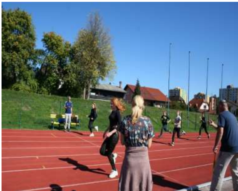
Atletski četverboj – tek 60 m