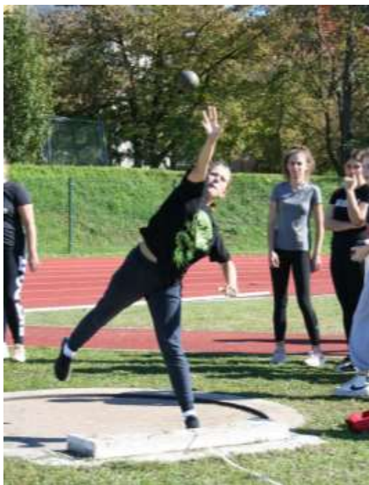
Atletski četverboj – suvanje krogle

Osnovni cilj vseh je bil vrniti se po nekaj letih spet na stadion ter dijake motivirati in spodbujati k športnemu udejstvovanju. V veliki meri nam je to tudi uspelo.