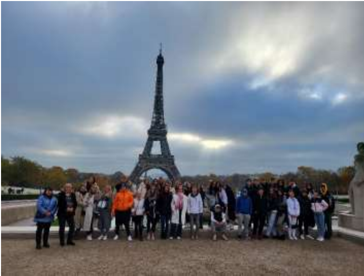
Ob Eifflovem stolpu