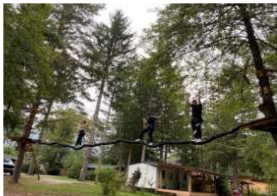
Najpogumnejši na tanki veji (Kamp Menina)