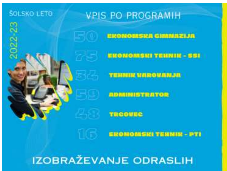
Izobraževanje odraslih, šolsko leto 2022/23 (vpis po programih)

V izobraževanju odraslih smo začeli z vpisom udeležencev v drugi polovici avgusta 2022 in ta je potekal vse do sredine oktobra, ko so pošla vsa razpisana mesta za izobraževanje v naših programih. Skupno smo v tem šolskem letu vpisali 282 udeležencev v šest programov: ekonomska gimnazija, tehnik varovanja, ekonomski tehnik – SSI, ekonomski tehnik – PTI, trgovec in administrator.