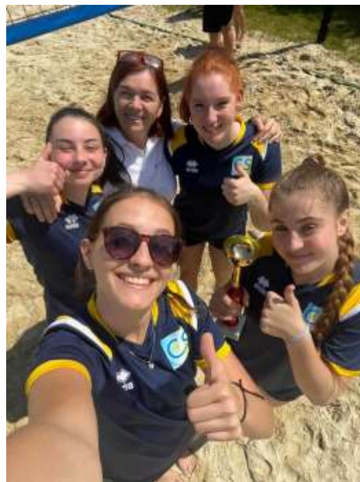
Selfi s pokalom