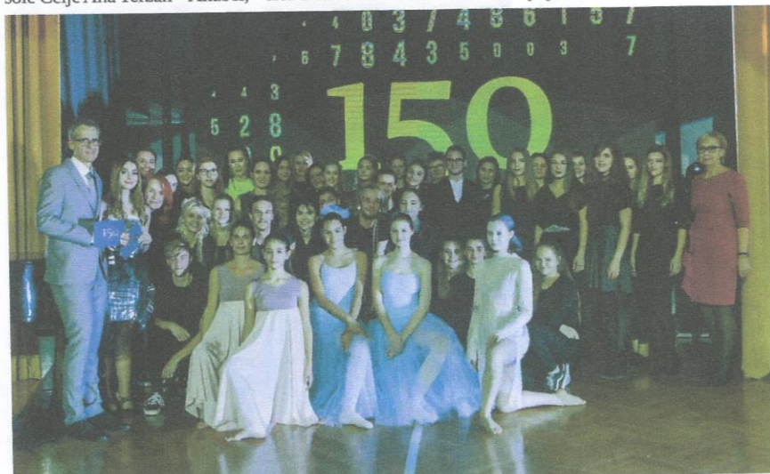
Nastopajoči na odlično izpeljani prireditvi.