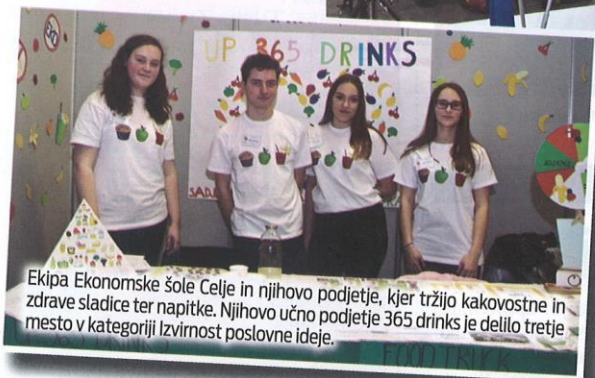
Ekipa Ekonomske šole Celje in njihovo podjetje, kjer tržijo kakovostne in zdrave sladice ter napitke. Njihovo učno podjetje 365 drinks je delilo tretje mesto v kategoriji Izvirnost poslovne ideje.

na sejmu predstavilo 52 učnih podjetij, od tega kar 22 iz tujine: Hrvaške, Avstrije, Srbije, Črne gore in Bolgarije.