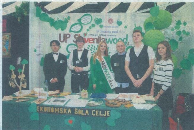
... in Slovenija wood