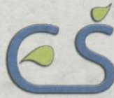
Stran Mladi za mlade so pripravili dijaki Ekonomske šole Celje.