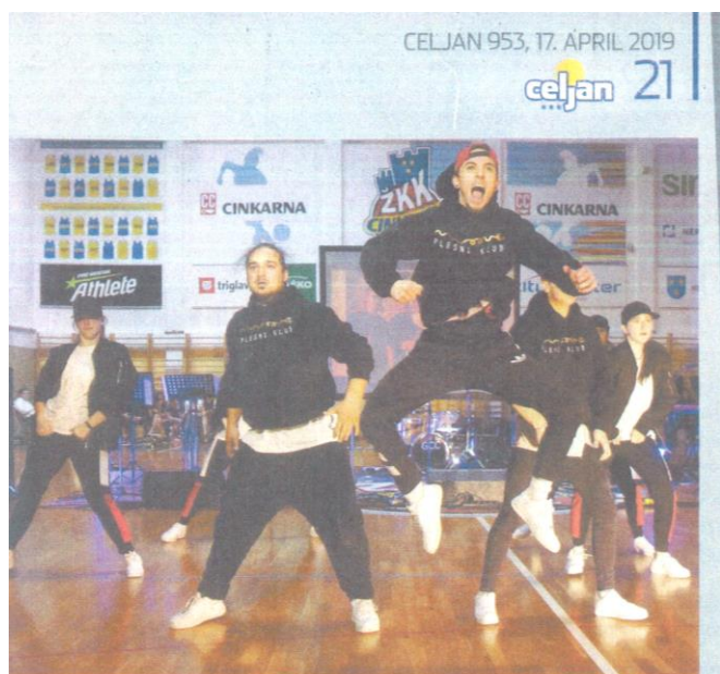
Plesna skupina Domin Tech.