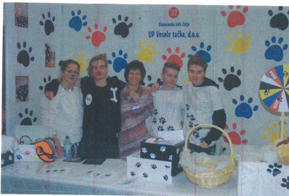
Učno podjetje Vesele tačke je zasedlo odlično peto mesto.

Šole, predstavnike šol in krožkov vabimo, da soustvarjajo stran za mlade v časopisu Celjan. Prispevke in vabila lahko pošljete na naslov urednik@celjan.si ali pokličete na 03 428 16 60.