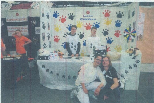
Ekipi učnih podjetij Vesele tačke ...