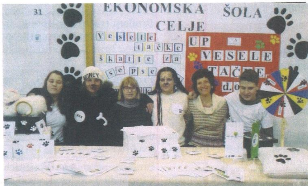
Učno podjetje z Ekonomske šole Celje je poželo veliko navdušenja.