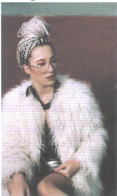
Pravi, da je po videzu izstopala že od nekdaj.

Kot majhna sva z bratom dvojčkom obiskovala ure klavirja in plesa, kasneje pa se je on podal v igralstvo, ki mu bolj leži. Starejši brat je bolj likovno nadarjen. Sama igram kitaro, klavir in ukulele. S klavirjem sem začela nekje pri sedmih letih, nato sem se še sama naučila igrati ukulele in kitaro.