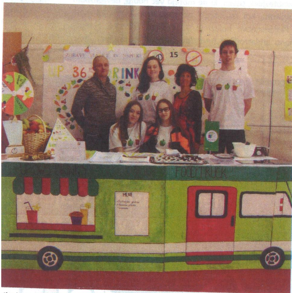
Mladi podjetniki na sejmu Altermed.