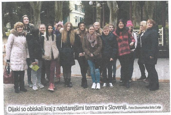
Dijaki so obiskali kraj z najstarejšimi termami v Sloveniji.

skali še Hišo kulturne dediščine – Zbirko Polenek, ki prikazuje predmete iz življenja in dela nekoč. V Termah Dobrna so spoznali njihovo zgodovino in poslovanje (ter sladice). Mladi Cvikl je zaključil z mislijo: »Cilj potovanj ni stopiti na tujo zemljo, pač pa stopiti na svojo zemljo s tujimi očmi.« (AG)