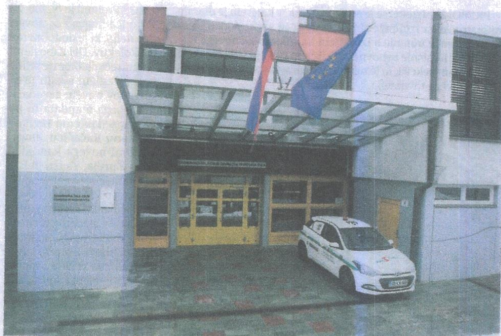
V srednji ekonomski šoli so poklic tehnik varovanja predstavili tudi na informativnem dnevu.