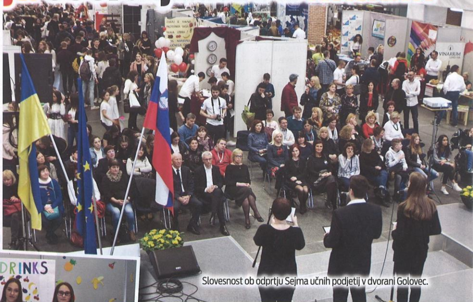
Slovesnost ob odprtju Sejma učnih podjetij v dvorani Golovec.

Ekonomška šola Celje je v sodelovanju s Centralo učnih podjetij Slovenije organizirala 13. Mednarodni sejem učnih podjetij. Kot poudarjajo organizatorji, dogodek ni pomemben samo za dijake in organizatorje, z njim skušajo promovirati ustvarjalnost mladih, nenazadnje pa je to tudi dobra promocija knežjega mesta. Letos se je