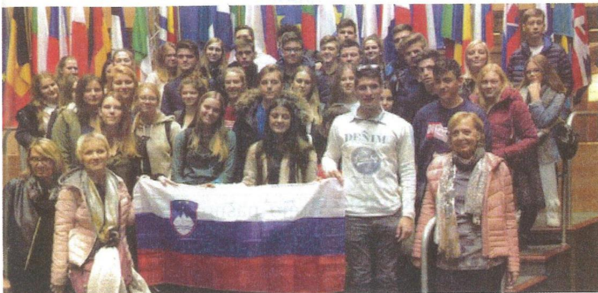
Dijaki Ekonomske šole Celje, Gimnazije in srednje šole, na strokovni ekskurziji.