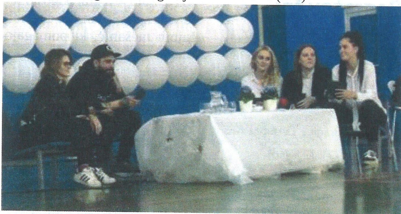
COOL FOTR in MAMASITA ter organizatorke dogodka.