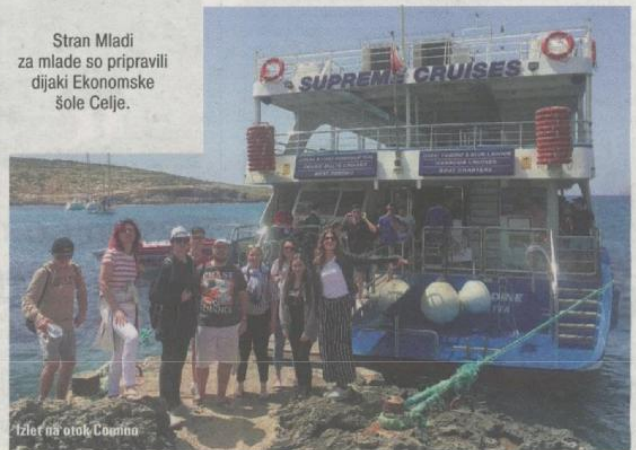
Izlet na otok Comino