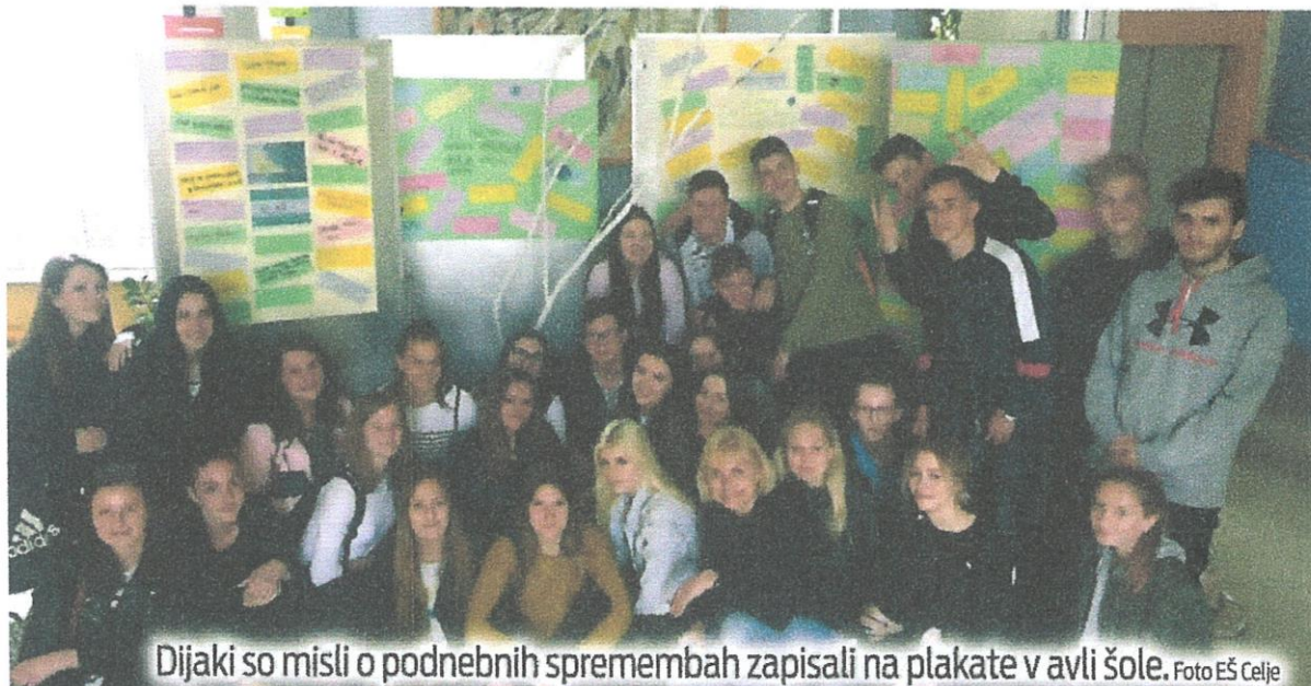
Dijaki so misli o podnebnih spremembah zapisali na plakate v avli šole.

Projektni dan so zaznamovala predavanja mentoric s šole in predavateljev z Umanotere o podnebnih spremembah, pretirani potrošnji, onesnaževanju prsti in zraka, gojenju industrijskega in organskega bombaža, pravični trgovini ter o potrebi po drugačnem načinu življenja in ravnanja z okoljem. Dogajanje so popestrili s kvizom in z aktivnim premislekom dijakov o predstavljeni problematiki. Projekt so sklenili s tekom podnebne solidarnosti po mestnem parku. (UC)