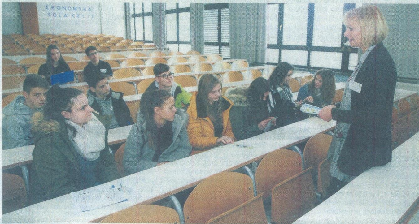
Večinoma so mladi prišli na ogled srednjih šol skupaj s starši. V Ekonomski šoli Celje so na primer po uvodni skupni predstavitvi dijaki otroke popeljali po šoli in jim predstavili delo, medtem ko so starši prisluhnili vodstvu šole in lahko vprašali, kar jih zanima.