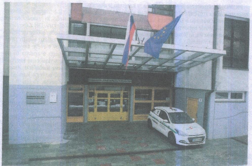
V srednji ekonomski šoli so poklic tehnik varovanja predstavili tudi na informativnem dnevu.