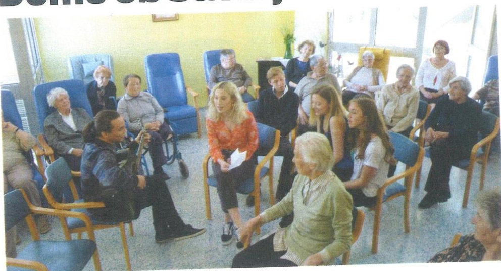
Dijaki Ekonomske šole Celje so razveseljevali stanovalce Doma ob Savinji.