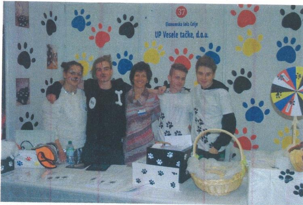
Učno podjetje Vesele tačke je zasedlo odlično peto mesto.

Šole, predstavnike šol in krožkov vabimo, da soustvarjajo stran za mlade v časopisu Celjan. Prispevke in vabila lahko pošljete na naslov urednik@celjan.si ali pokličete na 03 428 16 60.