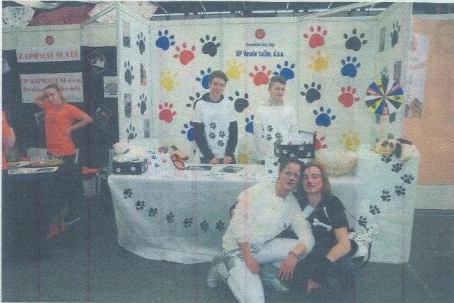
Ekipi učnih podjetij Vesele tačke ...