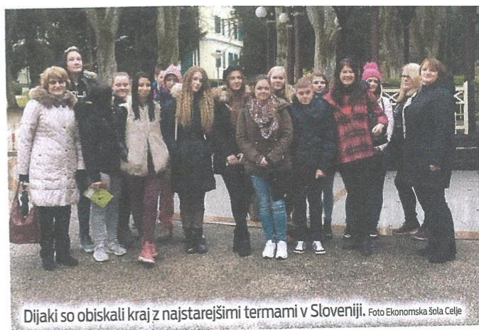
Dijaki so obiskali kraj z najstarejšimi termami v Sloveniji.

skali še Hišo kulturne dediščine – Zbirko Polenek, ki prikazuje predmete iz življenja in dela nekoč. V Termah Dobrna so spoznali njihovo zgodovino in poslovanje (ter sladice). Mladi Cvikl je zaključil z mislijo: »Cilj potovanj ni stopiti na tujo zemljo, pač pa stopiti na svojo zemljo s tujimi očmi.« (AG)