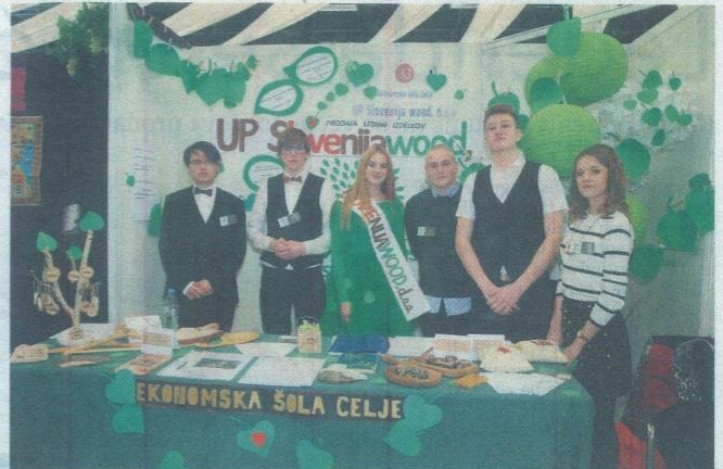
... in Slovenija wood