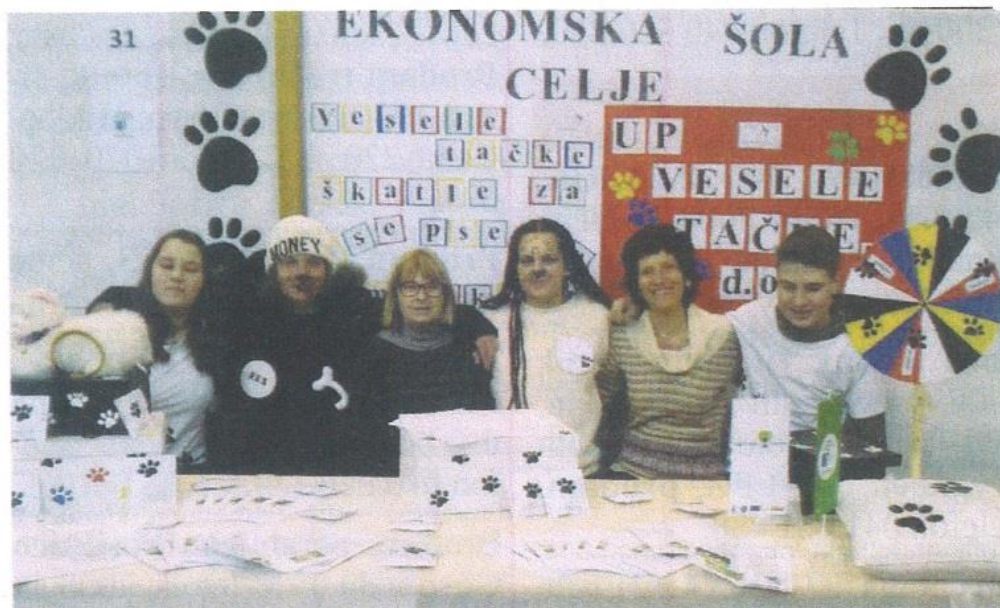
Učno podjetje z Ekonomske šole Celje je poželo veliko navdušenja.