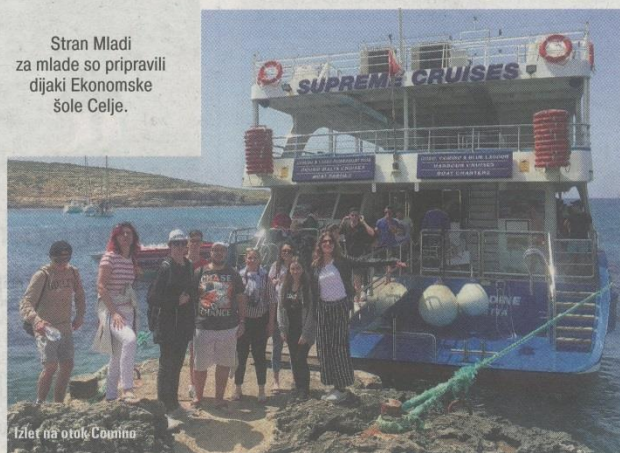
Izlet na otok Comino

Stran Mladi za mlade so pripravili dijaki Ekonomske šole Celje.