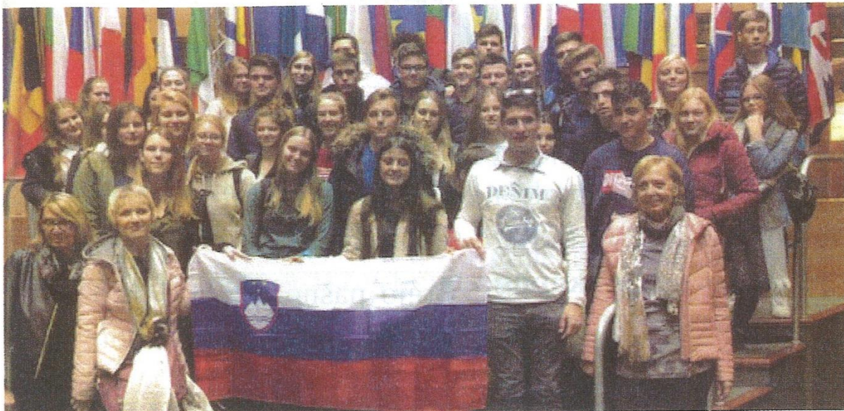
Dijaki Ekonomske šole Celje, Gimnazije in srednje šole, na strokovni ekskurziji.