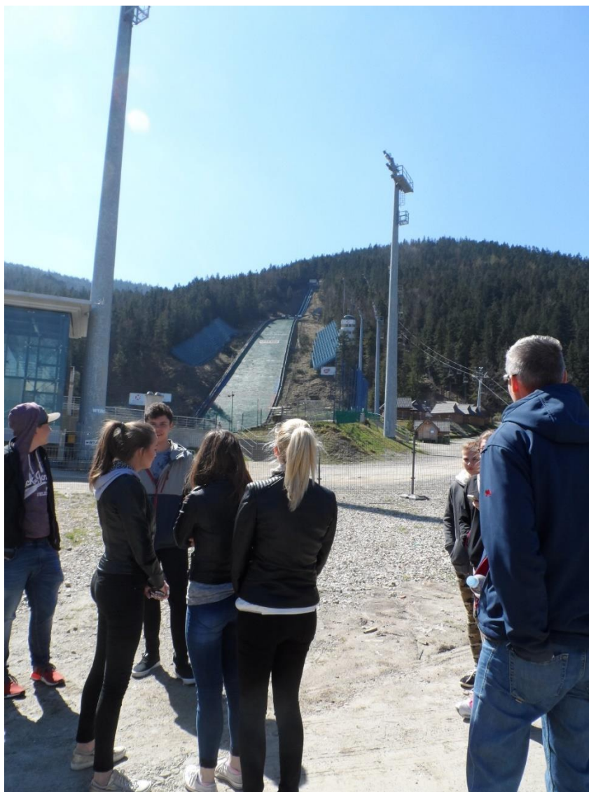
Skakalnice v Zakopanah

Ekскурzija je bila poučna in zanimiva za vse udeležence.