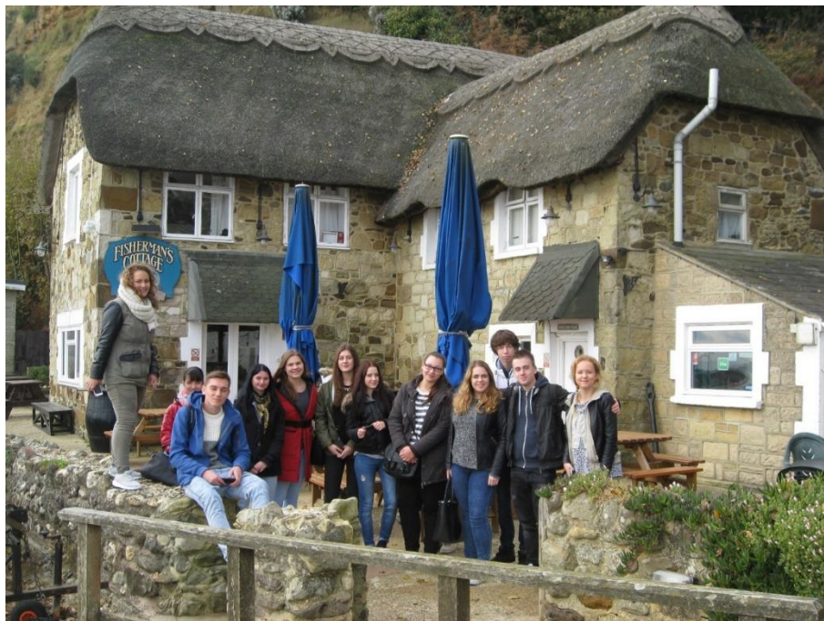
Izlet na otok Wight