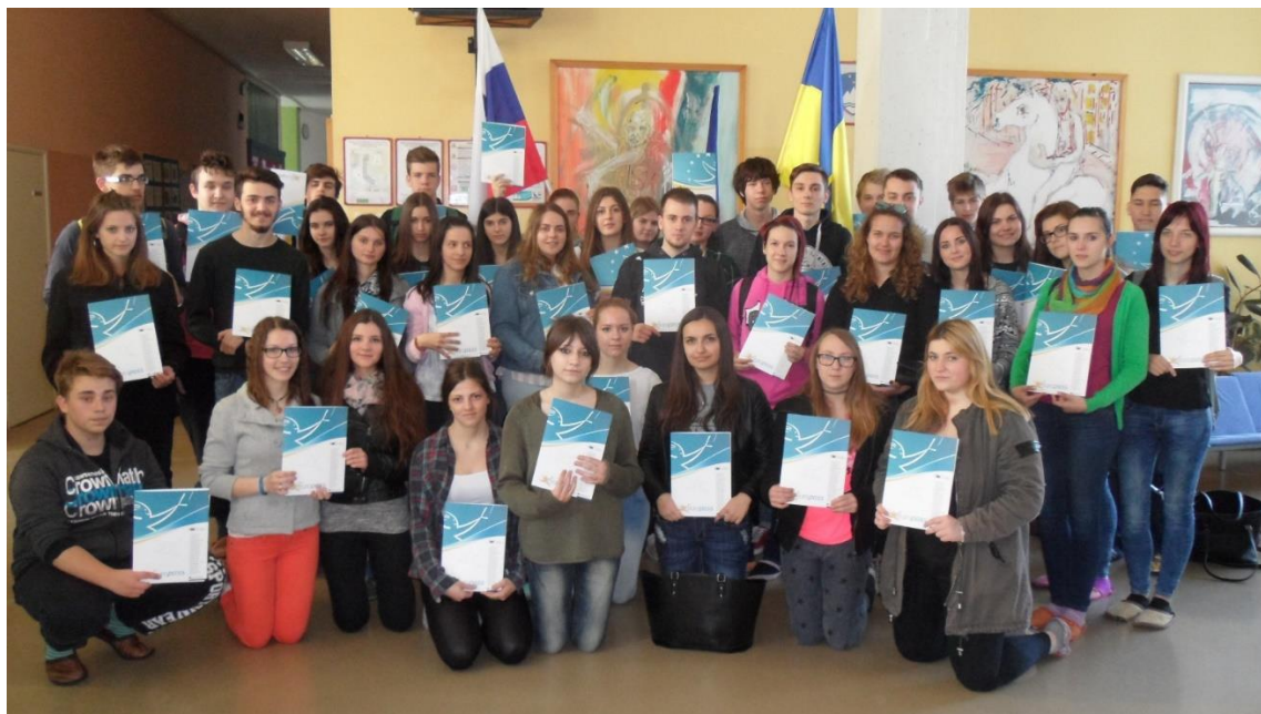
Erazmovci EŠC 2015–16 z Europassi