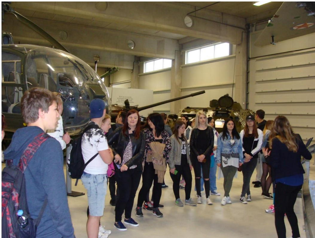
Vojaški muzej v Pivki

Dijakinje in dijaki 1. a, 3. č in 3. d so v torek, 10. maja 2016, skupaj s spremljevalci obiskali Park vojaške zgodovine v Pivki. Muzej je nastal na območju starih italijanskih kasarn. Prikazuje bogato vojaško in zgodovinsko dediščino. Namenjen je izobraževanju in raziskovanju.