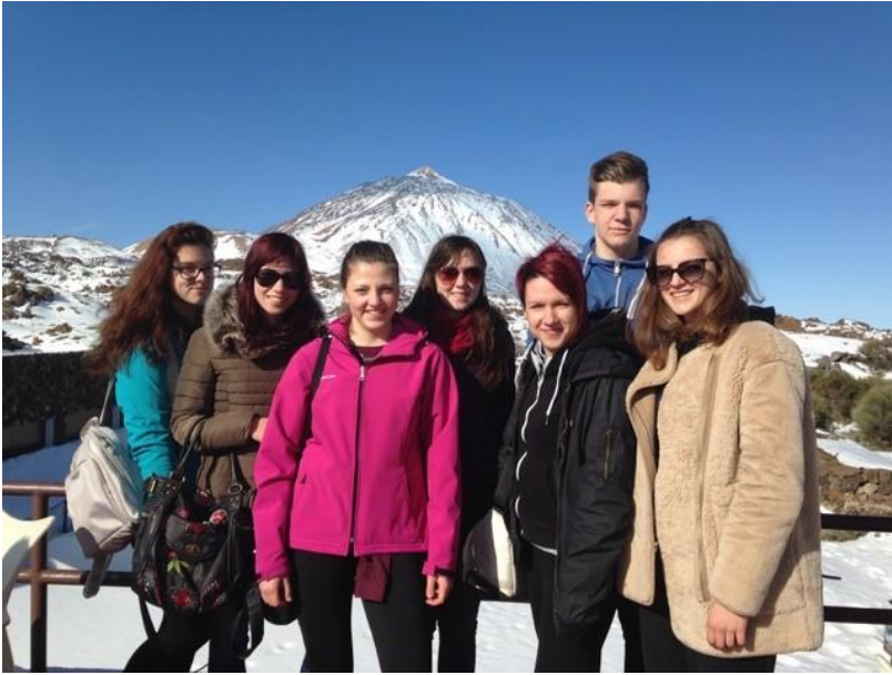
Ekskurzija na vulkan Teide na Tenerifu