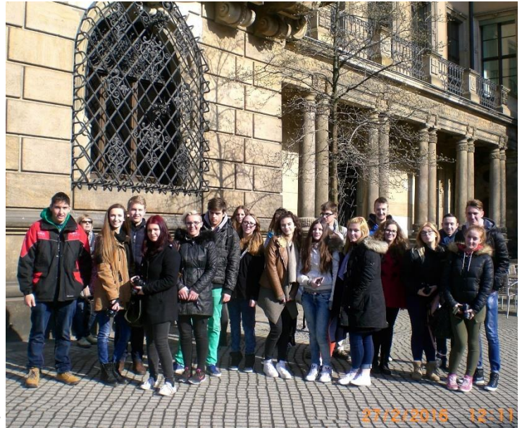
Prijetna družčina med raziskovanjem Dresdna