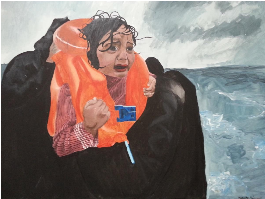
Maruša Šošterič, 4. a: Begunska deklica v morju, 2016 (tempera in akril na platno)