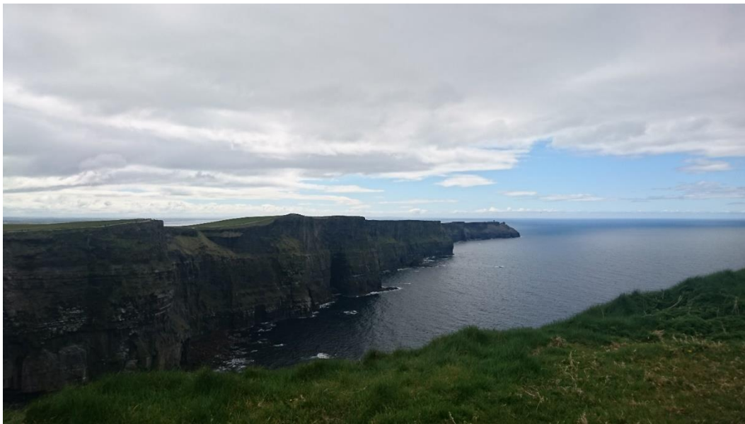
Cliffs of Moher

Drugi dan smo peš raziskovali irsko prestolnico. Sprehodili smo se po eni izmed najširših ulic v Evropi, O'Connell Street, kjer so ob drevoredni ulici različni spomeniki, posvečeni irski zgodovini in kulturi. Od teh je najpomembnejša zgradba glavne pošte, ki je poznana po velikonočni vstaji 1916. leta in The Spire of Dublin, ki je 121 metrov visoka konica, posvečena milenijski prenovi mestnega središča, prijaznejši za pešce. Ogledali smo si znameniti dublinski grad, slavni Trinity College, s svojo 400-letno tradicijo, kjer v zakladnici stare knjižnice hranijo rokopis – Book of Kells in druge starodavne zapise, ter Narodni muzej Irske.