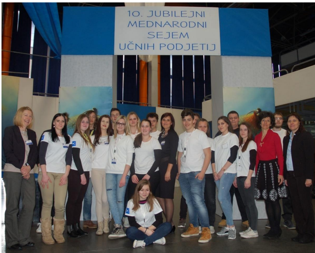
Sodelujoči na sejmu