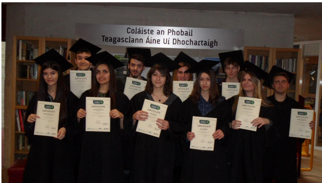
Uradna podelitev potrdil o opravljeni praksi v Derryju