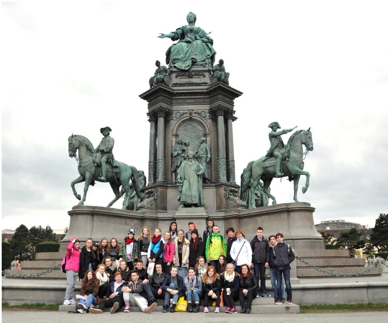
Pred spomenikom Marija Terezije