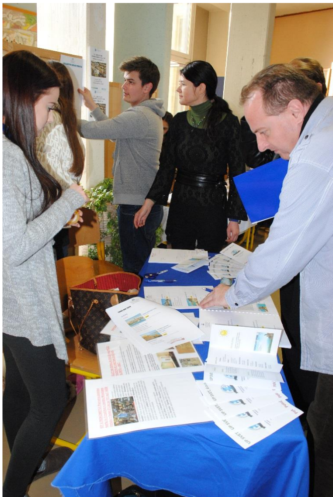
«Stroga» ocenjevalna komisija pregleduje poslovno dokumentacijo