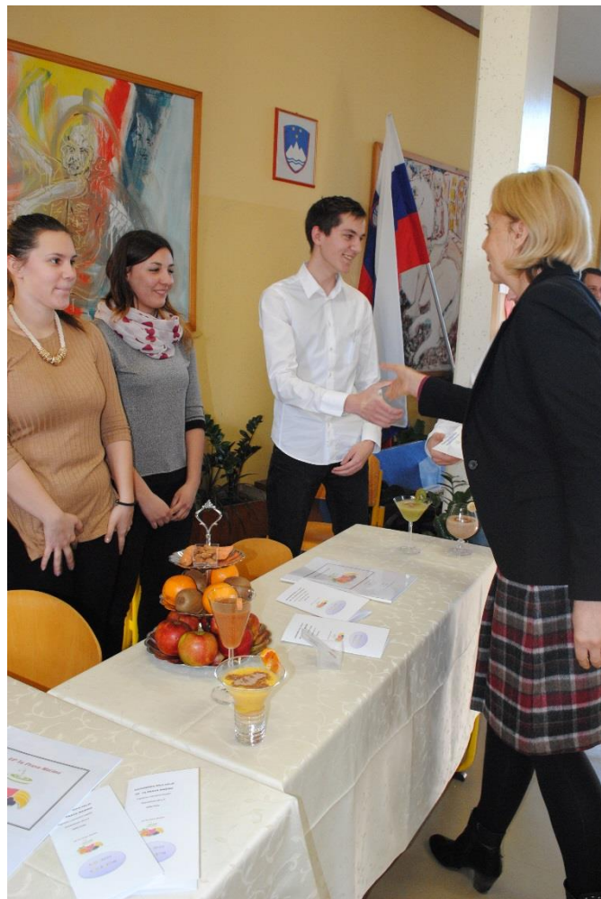
Zmagovalna ekipa in »mojstri smutijev« - Ta prava mašina