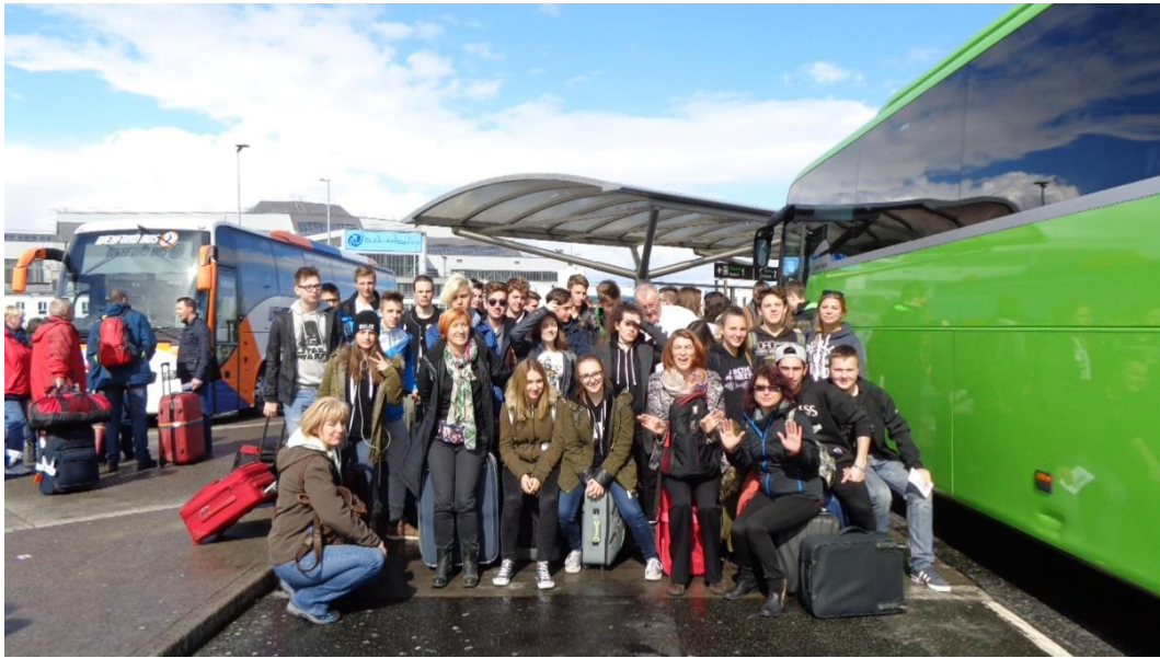
Dijaki EŠC in Šolskega centra Celje